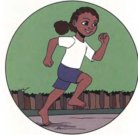
lekker in je vel